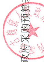
芮城县古魏镇人民政府2019年政府采购预算表