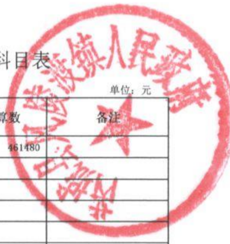
风陵渡镇2018年一般公共预算安排项目支出分经济科目表